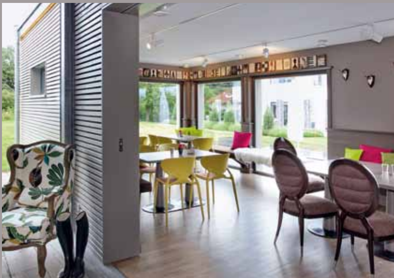
Show tearoom (Tyskland) - CLIPSO lofter Installation: SchwörerHaus KG, Jürgen Lippert