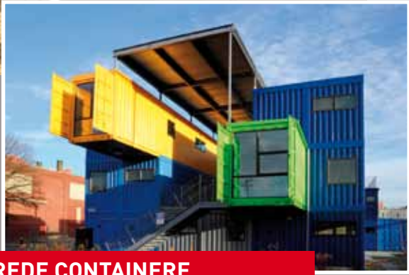
LEJLIGHEDER I RENOVEREDE CONTAINERE