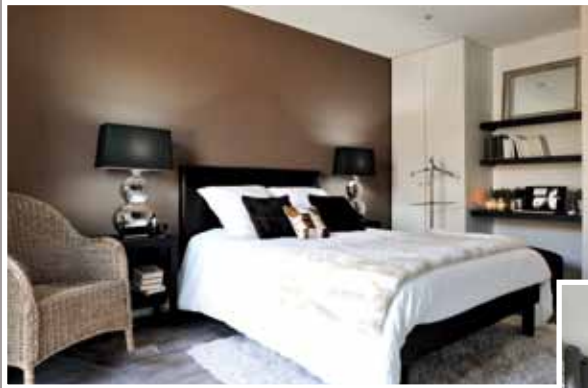
Modulife show home (Frankrig) - CLIPSO loft og vægge Installation: Groupe MCP, MODULIFE teknologi