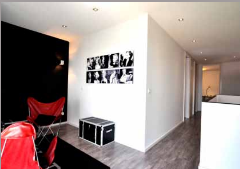
Modulife show home (Frankrig) - CLIPSO lofter og vægge Installation: Groupe MCP, MODULIFE teknologi