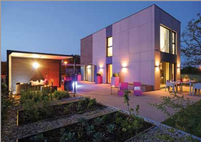
Modulife show home (Frankrig) - CLIPSO lofter og vægge Installation: Groupe MCP, MODULIFE teknologi